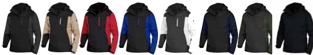
anthrazit schwarz beige schwarz rot schwarz royalblau schwarz weiß anthrazit marine schwarz oliv schwarz schwarz grau schwarz d.-grün schwarz

Gewebe: 100% Polyester Grammatuur: ca. 380 g/m 2 Art.-Nr.: 785180 Größen: XS (40/42) - 5XL (72/74) kein Größenaufschlag ab 1 St.: € 79,95 + MwSt. ab 10 St.: € 74,95 + MwSt.