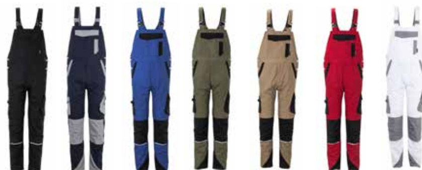
schwarz zink schwarzblau zink kornblau schwarz oliv schwarz sand schwarz rot schwarz weiß zink grün schwarz schiefer schwarz

Gewebe: 65% Polyester - 35% Baumwolle Grammatur: ca. 245 g/m 2 Art.-Nr.: 810130 (Herren) 810230 (Damen) Größen: XS - 4XL Damengr.: XS (34) - 4XL (48) ab 1 St.: € 33,95 + MwSt. ab 10 St.: € 30,95 + MwSt.