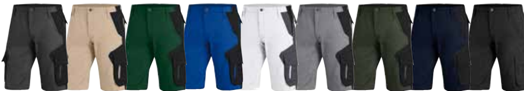
anthrazit beige d.-grün royalblau weiß grau oliv marine schwarz schwarz schwarz schwarz schwarz anthrazit schwarz schwarz schwarz