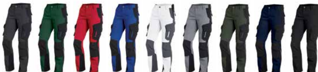
anthrazit d.-grün rot royalblau weiß grau oliv marine schwarz schwarz schwarz schwarz schwarz anthrazit schwarz schwarz schwarz