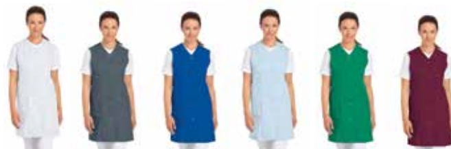
weiß grau königsblau hellblau gärtnergrün weinrot rot