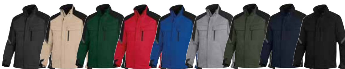
anthrazit beige d.-grün rot royalblau grau oliv marine schwarz schwarz schwarz schwarz schwarz schwarz schwarz schwarz schwarz schwarz