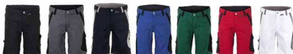
schwarz schiefer schwarz schwarzblau zink kornblau schwarz grün schwarz rot schwarz weiß zink sand schwarz oliv schwarz