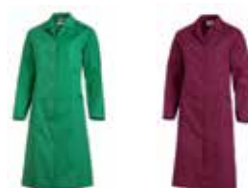
gärtnergrün bordeaux weiß königsblau