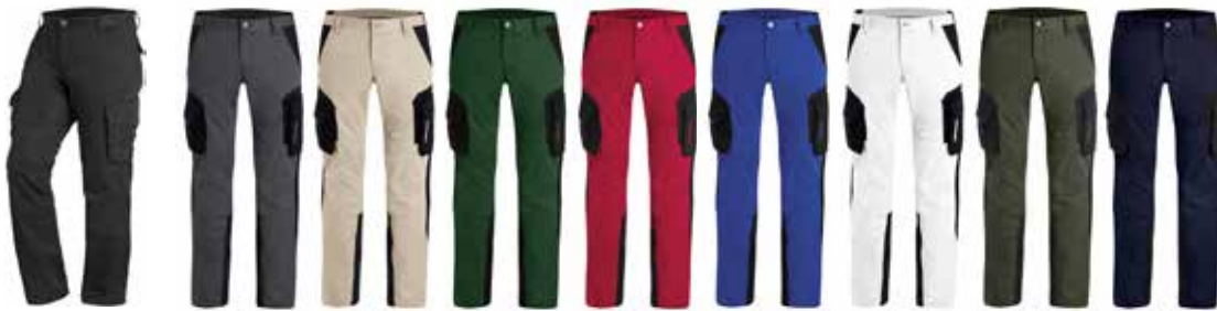
schwarz HOSE WERNER