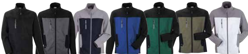
schwarz schiefer schwarzblau kornblau grün oliv weiß schwarz zink schwarz schwarz schwarz schwarz zink