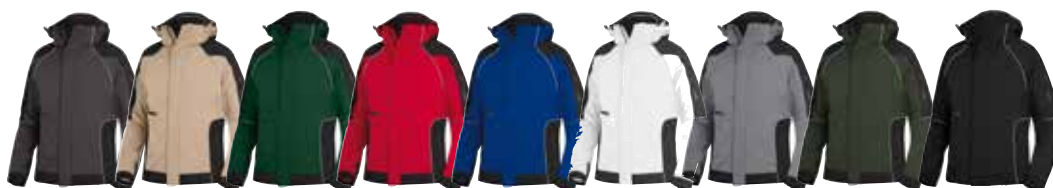
anthrazit schwarz beige schwarz d.-grün schwarz rot schwarz royalblau schwarz weiß anthrazit grau schwarz oliv schwarz schwarz marine schwarz