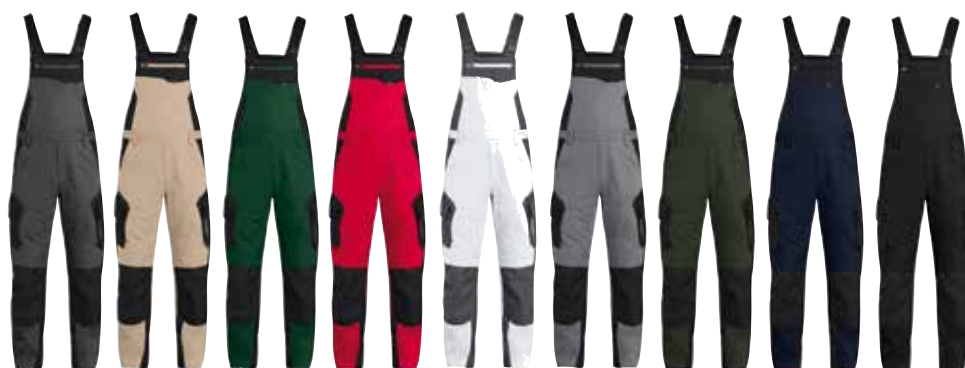
anthrazit beige d.-grün rot weiß grau oliv marine schwarz schwarz schwarz schwarz schwarz anthrazit schwarz schwarz schwarz schwarz