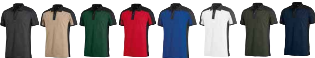
anthrazit schwarz beige schwarz d.-grün schwarz rot schwarz royalblau schwarz weiß anthrazit oliv schwarz marine schwarz