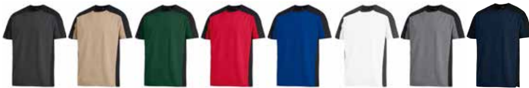
anthrazit schwarz beige schwarz d.-grün schwarz rot schwarz royalblau schwarz weiß anthrazit grau schwarz marine schwarz