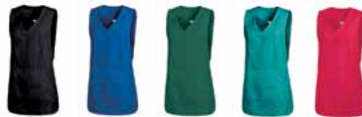
schwarz kö.-blau fl.-grün petrol rot