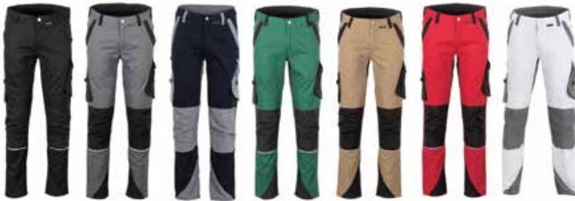
schwarz schiefer schwarzblau grün sand rot weiß schwarz zink schwarz schwarz schwarz schwarz zink