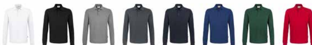
800750 800751 800752 800753 800754 800755 800756 800757 weiß schwarz titan anthrazit marine ultramarin d.-grün rot