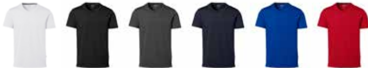
850600 weiß 850601 schwarz 850602 anthrazit 850603 marine 850604 royalblau 850605 rot

ab 1 St. € 12,95 + MwSt. ab 50 St. € 11,95 + MwSt. ab 100 St. € 10,95 + MwSt.