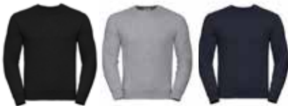
800701 800708 800703 schwarz hellgrau-mel. marine