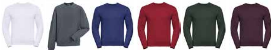
800709 800702 800704 800705 800706 800707 weiß convoygrau royalblau rot d.-grün weinrot