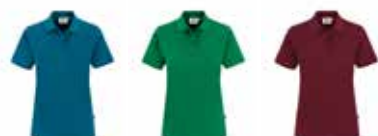
800137 petrol 800143 kellygrün 800139 weinrot