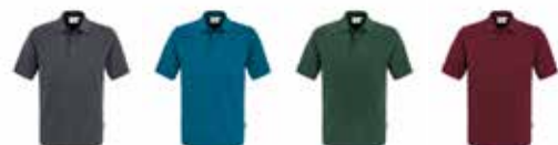
800502 graphit 800509 petrol 800508 d.-grün 800512 weinrot