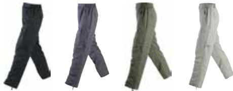
Herren: 879000 schwarz 879001 carbon 879002 oliv 879003 sand