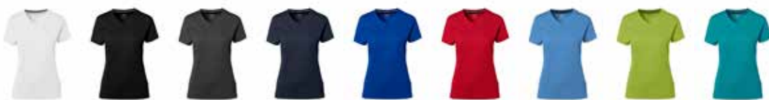
850610 weiß 850611 schwarz 850612 anthrazit 850613 marine 850614 royalblau 850615 rot 850616 malibublau 850617 kiwigrün 850618 smaragd

ab 1 St. € 12,95 + MwSt. ab 50 St. € 11,95 + MwSt. ab 100 St. € 10,95 + MwSt.