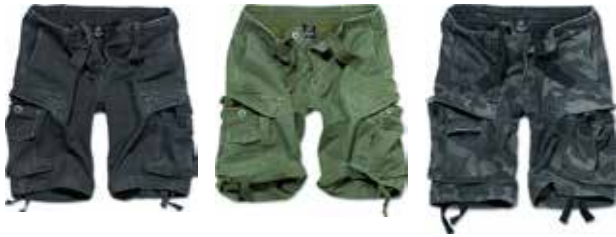
871600 871601 871602 schwarz oliv dark-camouflage

ab 1 St. € 36,95 + MwSt. ab 10 St. € 33,95 + MwSt.