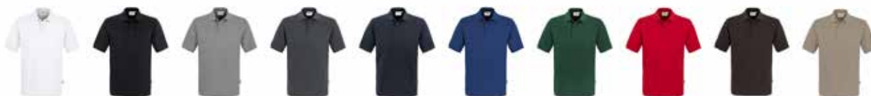
800450 800451 800452 800453 800454 800455 800456 800457 800458 800459 weiß schwarz titan anthrazit marine ultramarin d.-grün rot braun khaki