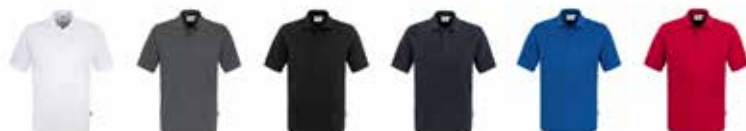
800500 weiß 800503 anthrazit 800504 schwarz 800505 marine 800506 royalblau 800511 rot