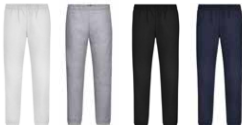
865000 865001 865002 865003 weiß grau-mel. schwarz marine