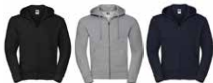
850451 850453 850454 schwarz h.-grau-mel. marine