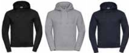
850351 850353 850354 schwarz h.-grau-mel. marine