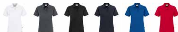
800130 weiß 800131 anthrazit 800132 schwarz 800133 marine 800134 royalblau 800138 rot