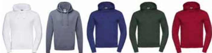
850350 850352 850355 850356 850357 weiß dunkelgrau royalblau d.-grün rot