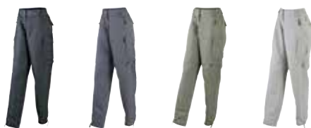
Damen: 879010 schwarz 879011 carbon 879012 oliv 879013 sand