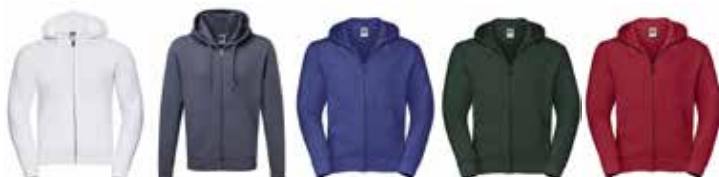
850450 850452 850455 850456 850457 weiß dunkelgrau royalblau d.-grün rot