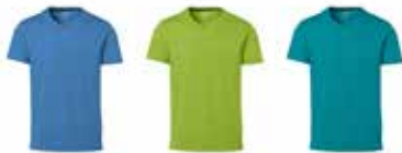
850606 malibublau 850607 kiwigrün 850608 smaragd